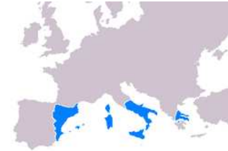
La Corona Catalano-Aragonesa al segle XV